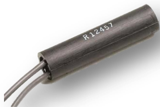
Reedschalter in zylindrischem Näherungssensor