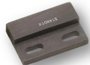
Erkennung der Tür- und Fensterposition