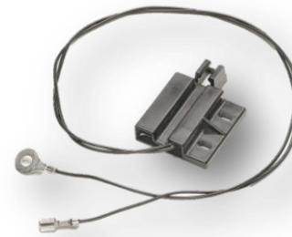
Kundenspezifische Baugruppe mit Sicherheitsschalter und Magnet