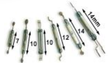
Offener Reedschalter für SMD Montage mit flachen oder runden Anschlüssen