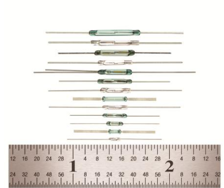
Reedschalter - Übersicht