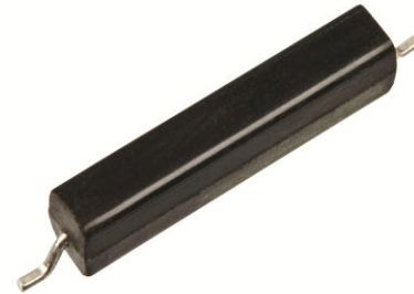
用于玻璃破碎监测及计量的贴片产品