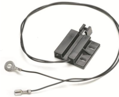
定制切断开关和磁铁组件