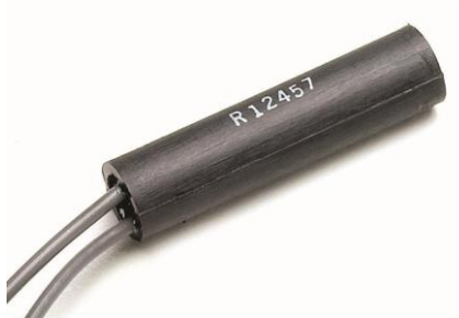
圆柱形接近传感器