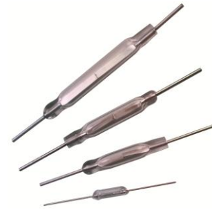
3.7mm 长干簧开关, 贴片设计