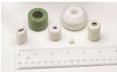
注塑式磁体/浮子组 件