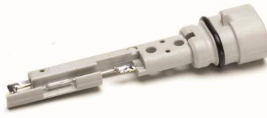
冷却剂波动箱传感器