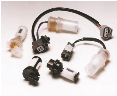
含线束连接器的汽车 冷却剂和洗涤液传感器