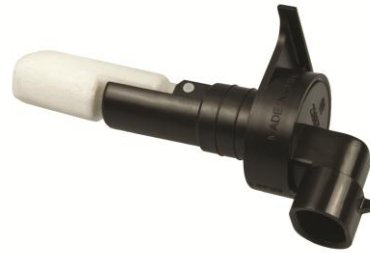
汽车风挡液传感器