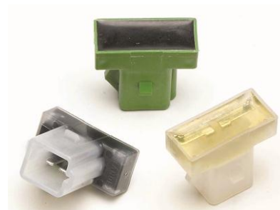
非侵入液位传感器