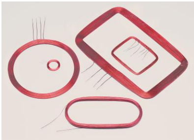
定制空心天线线圈