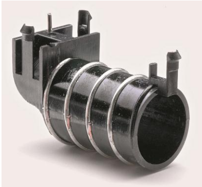
插入成型天线线圈