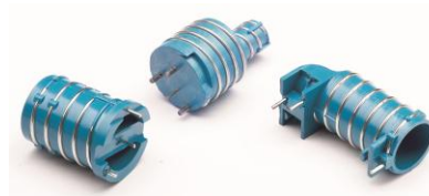
轮胎压力监测天线