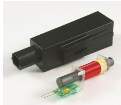
摩托车无钥匙进入装置