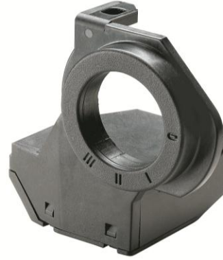
汽车防盗天线接收器，可定制封装